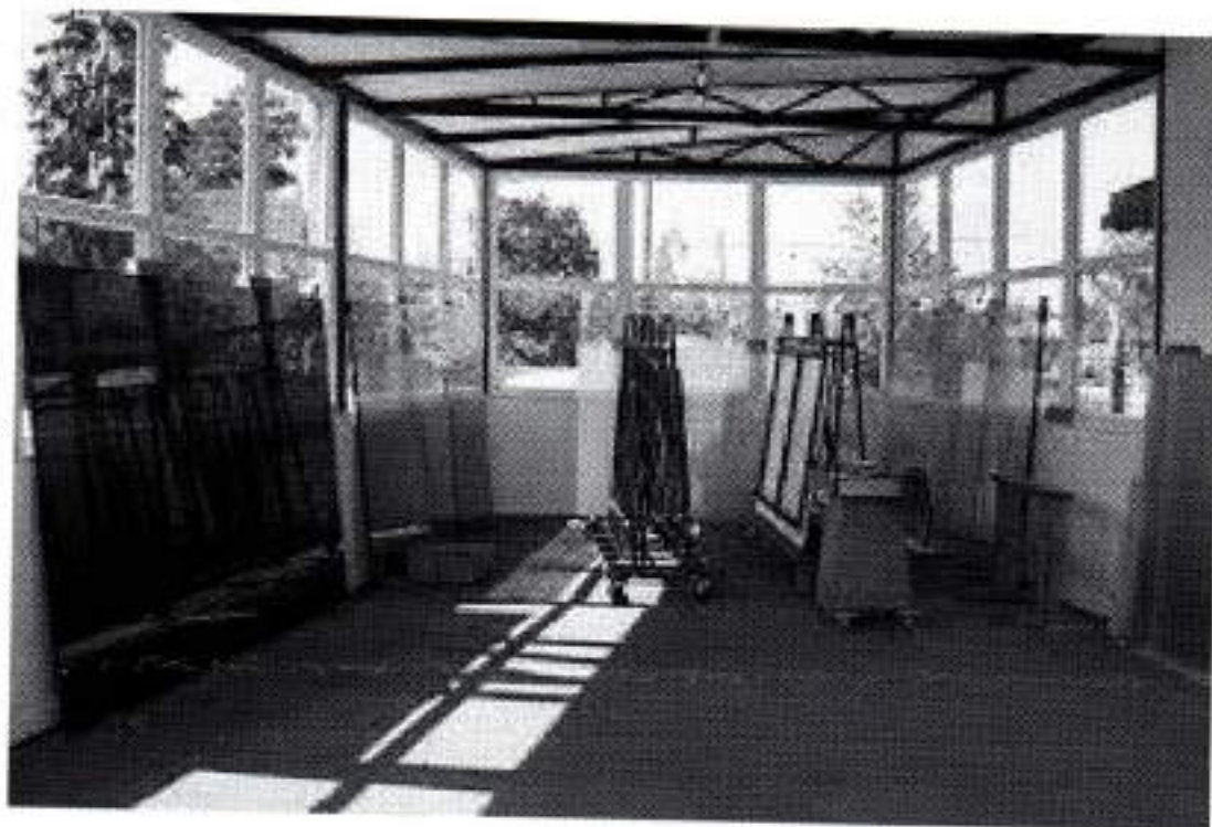
Minimalni mjesečni troškovi